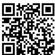
Videocatólogo de Pasarelas

Guion: Natalia Toledo Música original: Felipe Pérez Santiago y Vortice Ensemble Narración: Zamira Franco Dirección escénica: Antonio Zúñiga