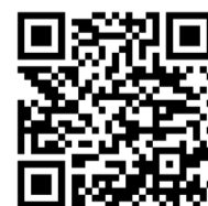
Encuentra aquí la programación completa de actividades

Programación del Cineclub Original y la proyección de documentales y cortometrajes en el Cine Sótano de la Casa Miguel Alemán.